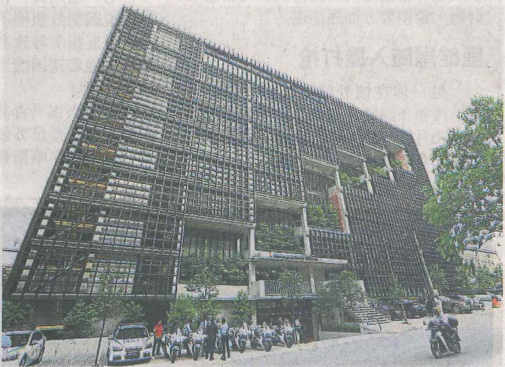
▲大马建筑师公会中心外型设计别具一格。

他披露，原本该会想在登托路购买一座4层楼的建筑，作为建筑师的艺术中心，惟2012年该会位于堂思路（Jalan Tangsi）的旧址接获隆市政局要求搬迁通知，所以才改变计划，造就了今天这座“新家”。